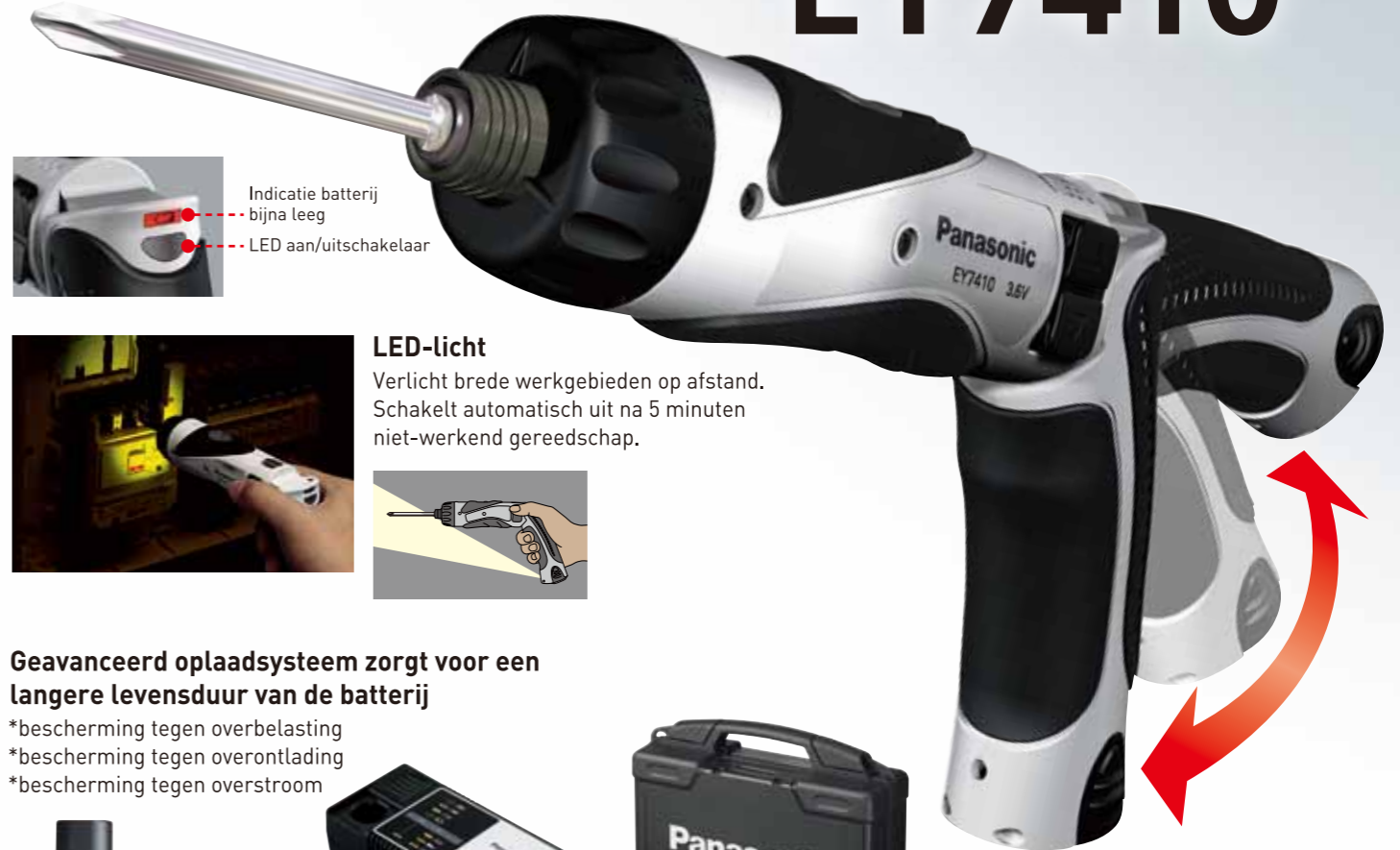
Indicatie batterij bijna leeg LED aan/uitschakelaar