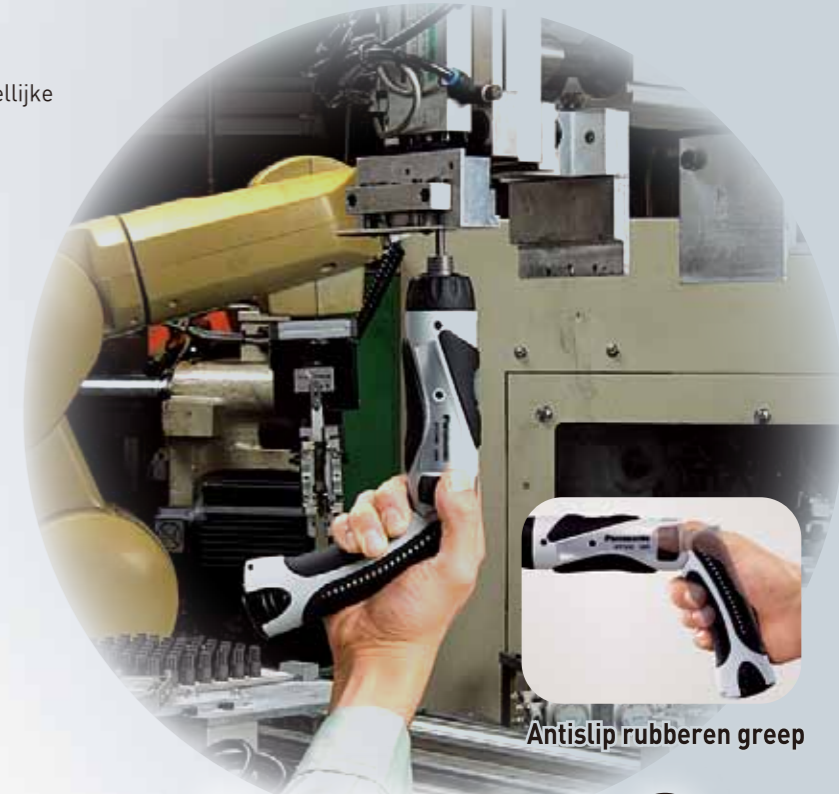
Antislip rubberen greep