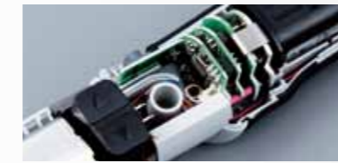
Ingebouwde automatische uitschakeling

Geavanceerde automatische schakelkoppeling biedt onmiddellijke rotatiestop bij het bereiken van het geselecteerde koppel.