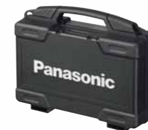
Stevige koffer met bit/bevestigingsmaterialen opslag