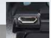
(USB Micro Type-B)