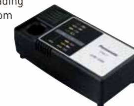
Snelle batterijlader EY0L11