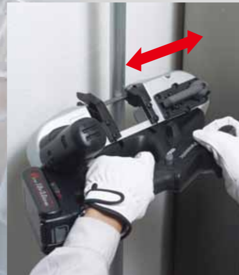
Kort bij wanden

Met de compacte zaagkop kunt u in kleine ruimtes komen. Met het gebruiksvriendelijke, uitgebalanceerde ontwerp kunt u verticale en horizontale zaagsneden maken, zodat u gemonteerd materiaal gemakkelijk kunt zagen.