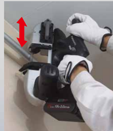
Kort bij plafonds