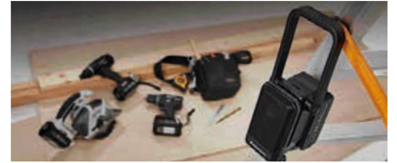
Łatwy do powieszenia podczas słuchania muzyki w pracy

Uwaga: Zdjęcie pokazuje zdjętą pokrywę głośników. Pokrywy pod żadnym pozorem nie należy otwierać czy usuwać.