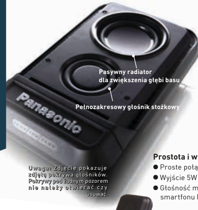
Pasywny radiator dla zwiększenia głębi basu