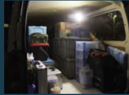
Do załadunku lub rozładunku samochodu