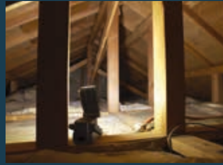
Do ciasnych i ciemnych przestrzeni, takich jak lofty i piwnice