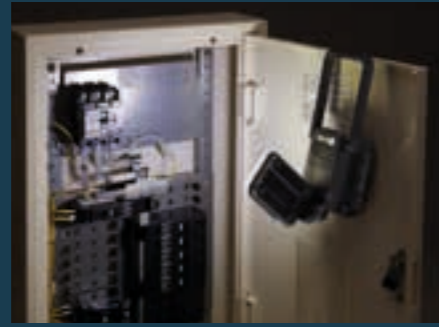
Do pracy lub konserwacji w zaciemnionych miejscach