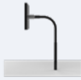
Montaż przy pomocy uchwytu typu „gęsia szyja”