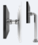
Montaż na profilu